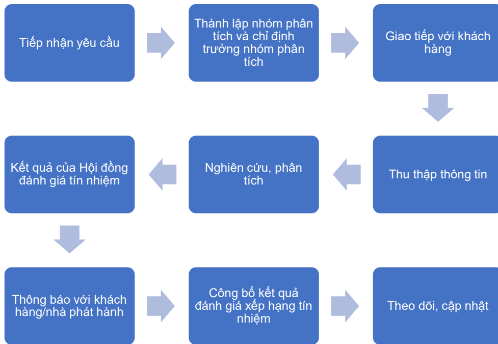
Biểu đồ 1: Quy trình xếp hạng tín nhiệm